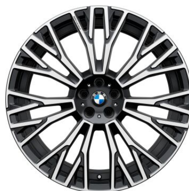
22" Individual Aerodinamične V- 1W7