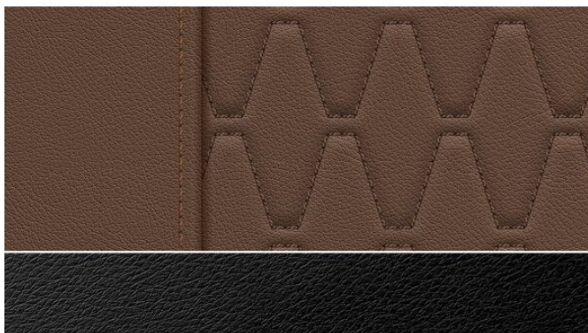
BMW Individual proširena 2.661,00 € koža "Merino" | Coffee VAHF