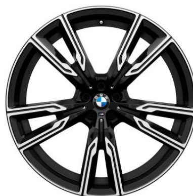
Alu. felne M V-Spoke style 0,00 € 22" 747 M Bicolour sa mix 1SM