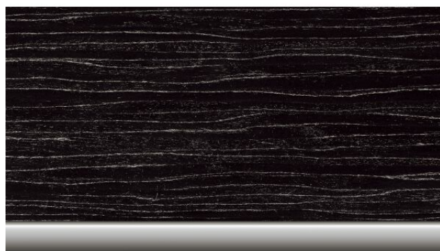
Unutrašnja lajsna "Fine- 243,00 € wood trim Fineline 4LM